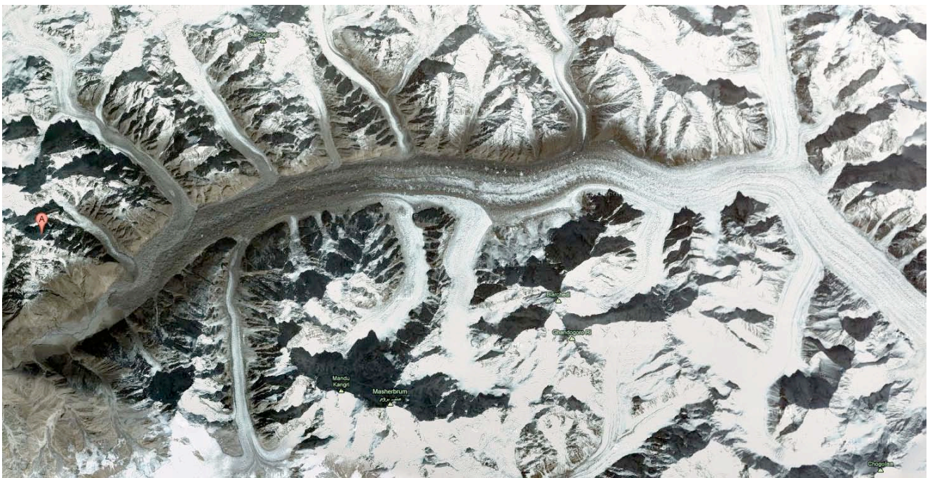
Paiju Peak mendiaren kokapena, Baltoro glaziarrean.

Paiju Peak, 6.610 metroko dorre ikusgarria, ederrean parerik gabea, mendi ahaztua da. Karakorumen barneratzen diren alpinistek aho bete hortz begiratzen diote beti mendi zorrotz horri, mira eginda ederresten dute haren silueta, baina aurrera jarraitzen dute beren bidean. Inork ez dio hortzik erakusten. Zortzimila metroko mendietara bidean izaten dira mendizale gehien-gehienak. Eta harkaitz eskalada maite dutenak, aldiz, horma garbiagoen bila menturatzen dira, elur eta izotz estalki hori ez duten mendietara: Trangoko mendigunera, esaterako. Hori dela eta, mendi harrigarri hori, denen begi-bistan egon arren, umezurtz eta bazterrera geratu da urteen joanean.