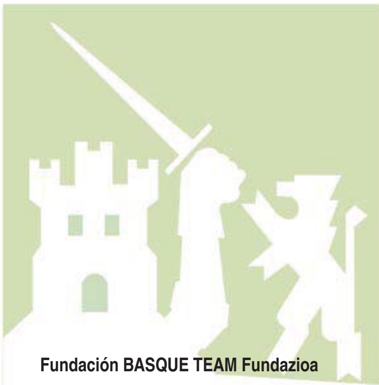
Fundación BASQUE TEAM Fundazioa