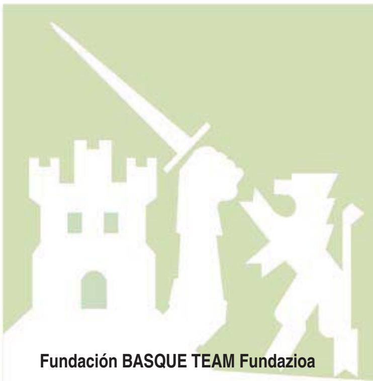
Fundación BASQUE TEAM Fundazioa