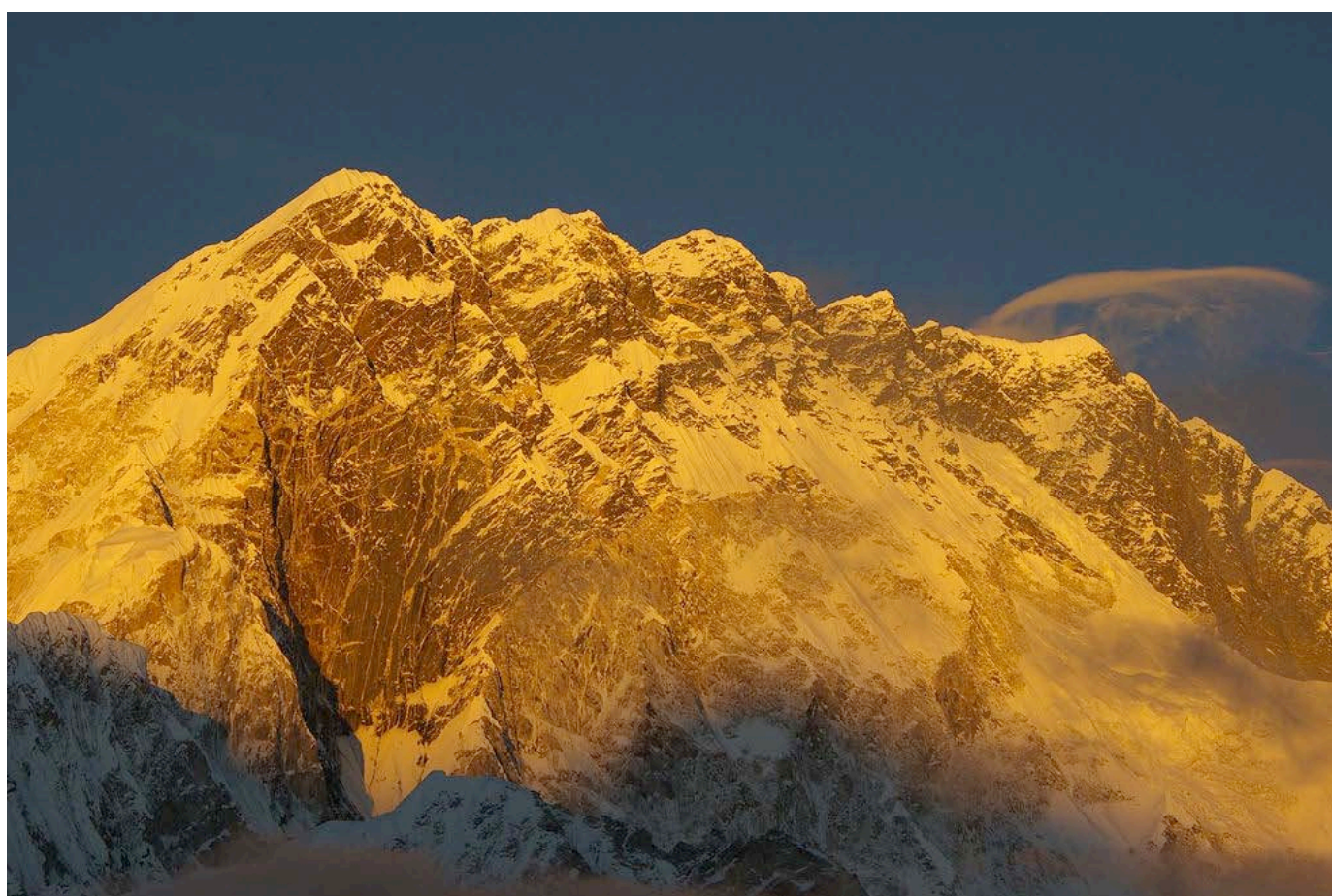
NUPTSE (7.861 m) Cara Sur en Estilo Alpino